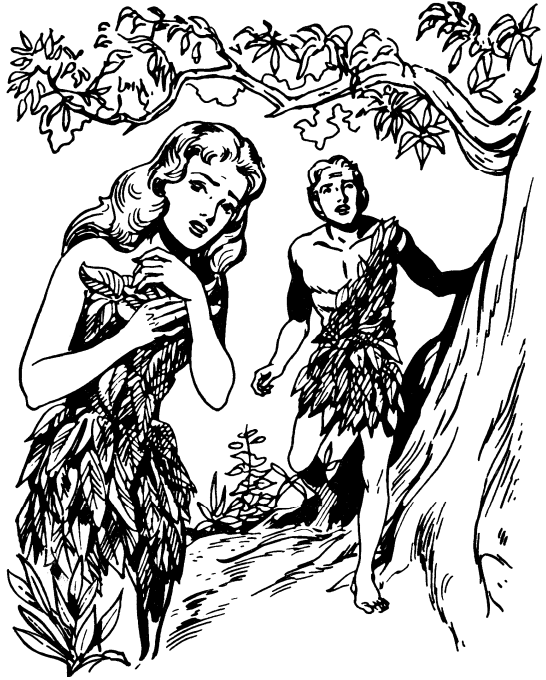
आदाम हिट्नुड् हाब्बा

८ हिट्नुड् हिट्ना युसा हिट्नागाचिडा माड्हाड् डाड्बा बाकेंचाडि