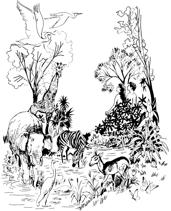
याप्मि, जिवाट्चि, डासाचि

नाराडोक् उपुण्टुव्क् हिट्नुड् ना नारा आधिकार चोगु॥ सामुन्राडिगा सोब्बे डासाचि, टाड्साड्डिगा नुवाचि, खाम्मिगा सोब्बे जिवाट्चि हिट्नुड् खाम्मि सोट्सा उलाम्टिगा जिवाट्चि खानि मुक्डि पिनाँनि॥ २६ पुयानुम्, आडा खान्चि लोड्सा सोब्बे पारिक्डागा चालिक् पुलिक् ओकोबुगा उभुड्माचि हिट्नुड् आ- आप्पे पारागा लालिक्