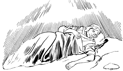
याकुबडा सेम्माइ माक्टुना

१० याकुब बेरसेबा ओलोडुना डेन् पोक्टुइ हारानलेइ खाडे॥ ११ नाम् ठायानाँ याकुब ठिक् सेइसेइना डेन्डि टासुइ हिट्ना युसा उन् हिट्नि बास हेन्से॥ हिट्निगा लुङ्गेऱ्वाचिडि ठिक् लुङ्गेऱ्वाडाना ओटाइगोइ चोगुइ उन् हिट्नि इम्से॥ १२ उन्डा ठिक् सेम्माइ माक्टुए॥