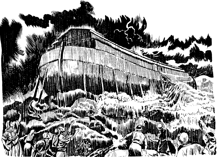
व्हेट् हिट्नुङ् याप्मिचि

११ नोआडा डा साय बारखा टासुनाँ इण्पोक् माइनाडाना ठिक्सि ७ गाते नारा उछिक्डिगा चुवा उपुन्चि उपुन्डे हिट्नुङ् टाङ्साडिगा वेहेट् उपुन्चिगा हुवारिक् चा ओङ्से ॥ १२ हिट्नुङ् लेन्सेन् लेम्बोक् मेक् लेम्बा सोम्मा वेहेट् टाया याक्टे ॥ १३ हिट्नाबेलालोक् नोआ, ओटालिमाङ् हिट्नुङ् सुम्बाङ् उइछाचि सेम, हाम लोक् येपेत हिट्नुङ् ओपाङ्गुमेट्चि चुवाखोङ्डाङ्डि उलिगे ॥ १४ हिट्नागालोक् पारिक् पारिक्गा ठेगा- खाट्टियुगा पाडि ओम्बालाक्, जाङ्गालाडि उलिगा, खाम्डि सोट्सा ओलाम्टिगा जिवाट्चि हिट्नुङ् पारा पारागा नुवाचि चा चुवाखोङ्डाङ्डि उलिगे ॥ १५-१६ माङ्हाङ्डा नोआ लोडु गाङ्डे सोब्बे पारिक्डागा