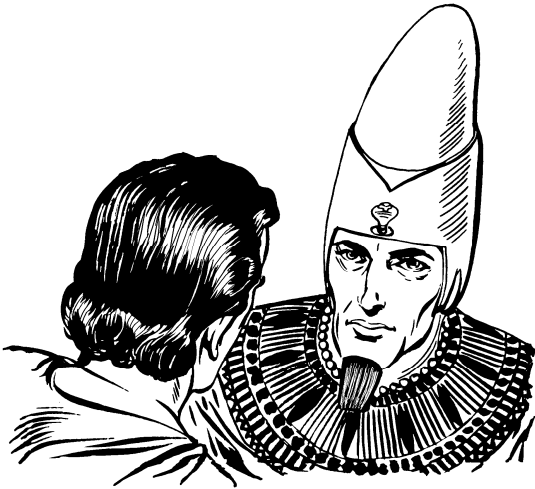
योसेफ लोक् फारो हाड्

२८ आडा माट्टुड् गाण्वारोक् ना लियुक् पोड्भोने माड्हाड्डा पाक् चोक्मा इट्टुएना हिट्ना खान् मानिमेट्टेसे ॥ २९ सि बारखा टेप्पा रूवाप्पा मिस्सा देसाडि ठेना साहाकाल लियुक् ॥ ३० हिट्नुड्डना सि बारखा सोम्मा आनिकाल ठायुक् ॥ आनिकालडा देसा जाखाम् चोगुटु हिट्नुड् हिट्ना साहाकाल लिसाना बारखा सोब्बेडा उमुन्दुटु ॥ ३१ साहाकाल लिसाना बेला फ्याड् उमुन्दुडेसुटु पोड्भोने हिट्ना आनिकाल औधिलोक् ठेना लियुक् ॥ ३२ खान्डा आमाक्कुना सेम्माड् इप्पोक् खेप् लिमाबाक् माड्हाड्डा ना रिड् चोक्माना निरनाए चोक्मा हिडुएसुए हिट्नुड् ना एलारोक् पुरा चोगुटु ॥