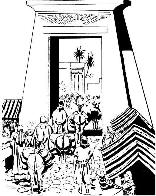
चासोक् इन्सिडा याप्मिचि मिस्त्राडि

४६ रूवाप्पा मिस्त्रा देसाडि आनिकाल लिसे हिट्नुड् योसेफडा सिरिखुरि ढुङ्गुरिचि ओड्सुड् मिस्त्रि याप्चिडि चासोक् छोड्मा ठालाँ चोगुए॥ ४७ हिट्डेउड् नाराटेप्पा याप्मिचि मिस्त्रा देसाडि योसेफसोरि चासोक् इन्ना ओटाए पोड्भोने नाराटेप् औधिरोक् आनिकाल ठाएसाना॥