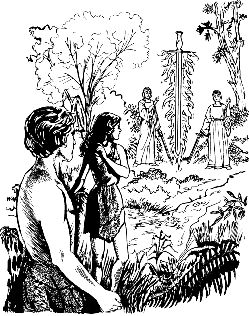
यापमि हिट्नुइ ओम्साना चेप्सा

यापमि खाम्लाम्मा चोक्बालाक्, खाम्डिडोक् टोऱ्वालासि चोक्डा लाहाबा चोगुए॥ २४ टाबो माइहाइ डाइबाडा बाकेंचाडि साक्चा खाम्पा उहिनिचानुइ जिबान आपिना सिइभुइमाडाना टुल्फुल कोसिडा आदानडाना बाकेंचाडाना नाम् होम्मालेइ टोनालोक्डिगा पारनिचि हिट्नुइ सोब्बेलेइ कोप्टुयाक्टुना ओम्मासोम् ओम्ना ठिक् ठेना चेप्सा युइसुए॥