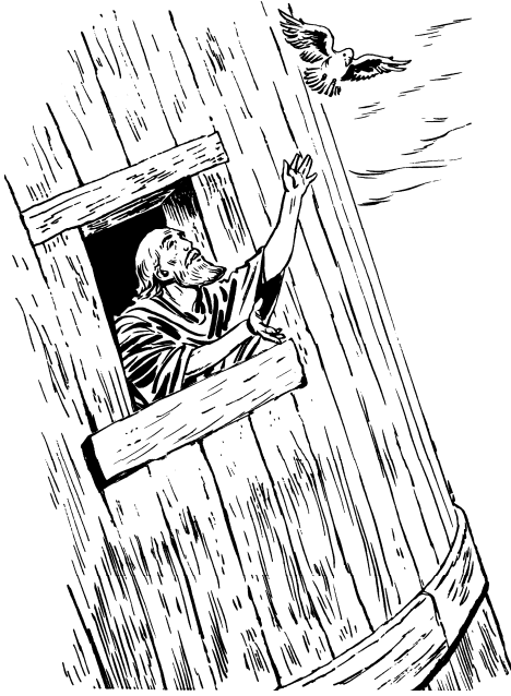
नोआडा ढुकुर लेडुना

माइना ओएङ्स्वालेङ् भोन्भोबाडागा ओछोम्बो आठेट्टे ॥